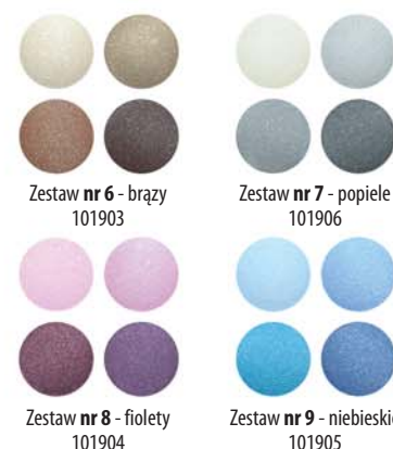
Zestaw nr 6 - brązy 101903 Zestaw nr 7 - popiele 101906 Zestaw nr 8 - fioleto 101904 Zestaw nr 9 - niebieskie 101905