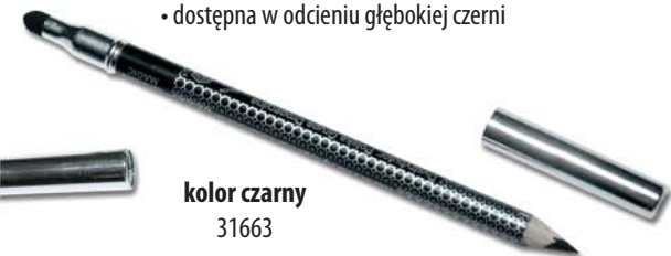
kolor czarny 31663